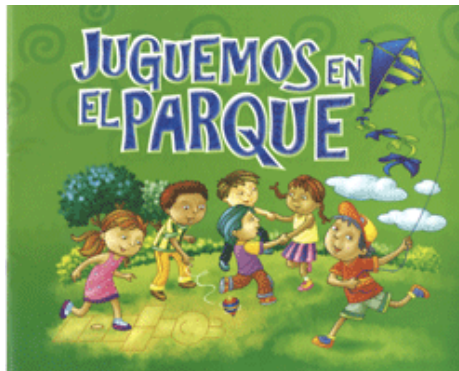
Juegos Tradicionales el 6 de diciembre