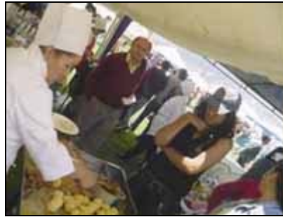
Festival de Comidas nacionales